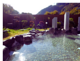
天然温泉 つたの湯