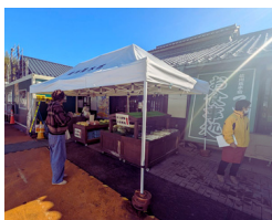
売店 (直売所・お土産品)