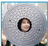
マンホール蓋・ 腐食金属愛好家 傭兵 鉄子