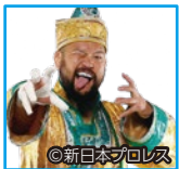
プロレスラー グレート-O-カーン