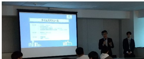
▲イントロ・未来会の紹介

参加者：国土交通省、埼玉県、ヴェオリア・ジェネッツ、極東技工コンサルタント、月島JFEアクアソリューション、東亜グラウト工業、日本水工設計、前澤工業、前田建設工業、メタウォーター