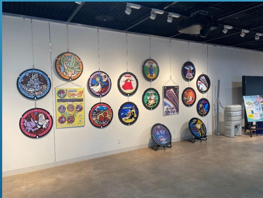
デザインマンホールと雨水貯留タンク（北九州市展示）