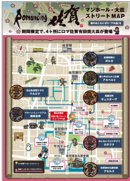
デザインマンホール設置場所

どちらも熱狂的なファンが多く、これらのコンテンツを組み合わせた結果、ファンにはたまらないマンホールカードになりました。配布場所は「最終皇帝」のマンホールが目の前に設置されている、佐賀工房 パルーンミュージアム店にお願いしているため、デザインマンホール蓋の散策→マンホールカードGETの流れで佐賀市の街中を楽しんでもらえます。