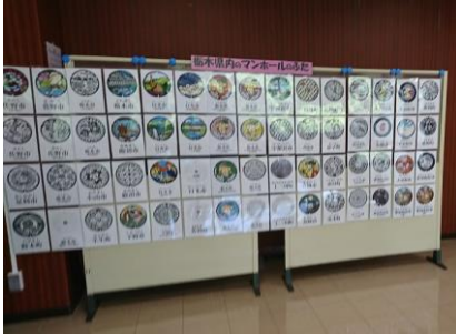
栃木県内マンホール蓋デザイン展示