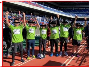
下水道健康駅伝大会出場の様子

エントリー事例の特徴（施策等そのものの特徴ではなく、施策等を発信する広報戦略及びその効果が優れていると考えている点を明記願います）