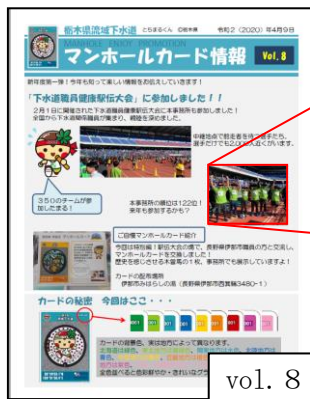
vol. 8 (令和2年4月発行)