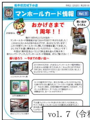
vol. 7 (令和2年2月発行)

マンホールカードの情報を収集してまとめた「マンホールカード情報誌」を職員で作成し、事務所ホームページ上で掲載を行っている。（6月末現在でvol. 9まで発行中）。