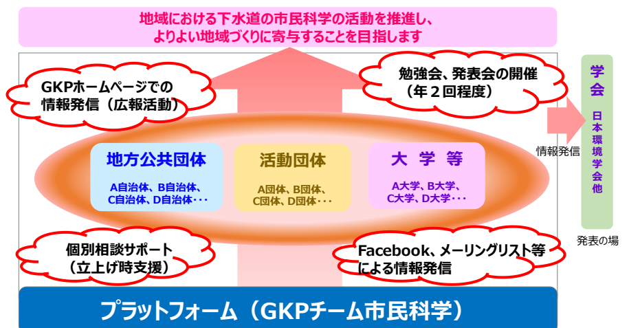
プラットフォームの概念図

プラットフォーム「GKP チーム市民科学」では、個別相談サポートや市民科学勉強会・発表会等を通じて、市民科学の認知度向上、地域における市民科学の活動の推進を支援します。