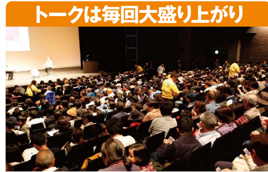
トークは毎回大盛り上がり

マンホール蓋の奥深い楽しさをトーク、グッズ販売、実物展示などを通して発信するイベント。今回は、「事始めのまち池田から発信!」をサブテーマに、全国唯一の府県をまたぐ「猪名川流域下水道関連自治体」が協力して、皆様にマンホールの楽しみをくり広げます。参加費無料で記念品も沢山あるので是非参加して君もマンホーラーになろう♪