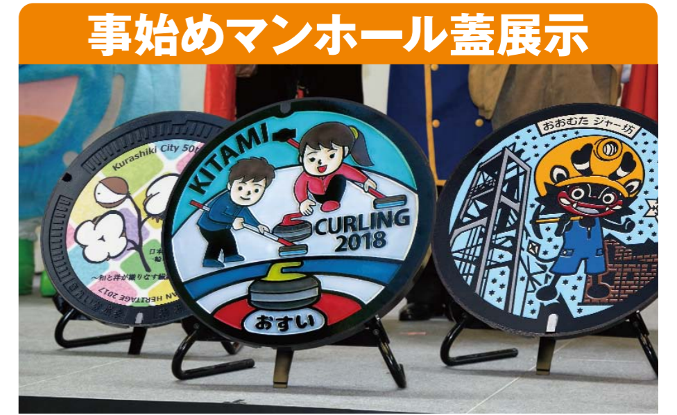
事始めマンホール蓋展示