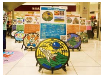
※写真は過去に開催したイベントの様子